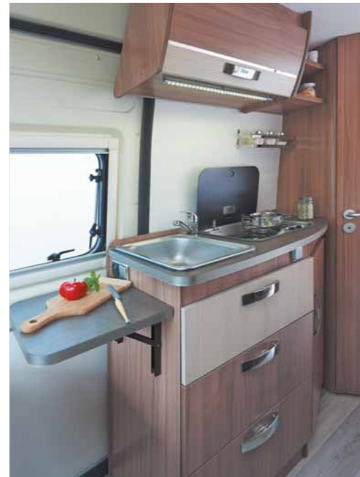
Praktische, komplett ausgestattete Küche mit Edelstahlspüle, Herd mit piezoelektrischem System, Schubfächern mit Schließhilfe und Beistelltisch Cuisine fonctionnelle toute équipée : évier inox, réchaud à allumage piezzo, tiroirs avec fermeture assistée, desserte amovible

Pratique et fonctionnel, chaque espace de vie du bantam Van est optimisé pour vous garantir un intérieur agréable à vivre et des volumes de rangement optimaux.