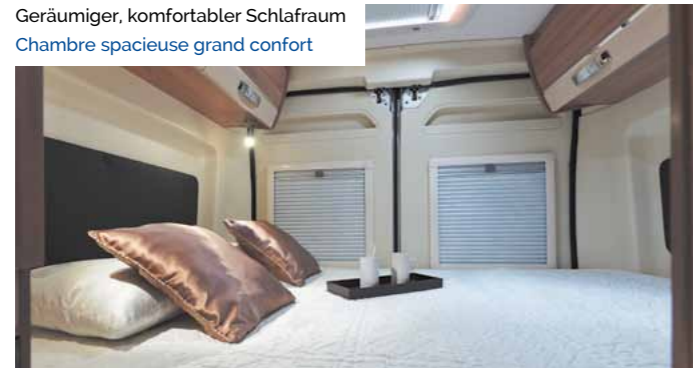
Geräumiger, komfortabler Schlafraum Chambre spacieuse grand confort