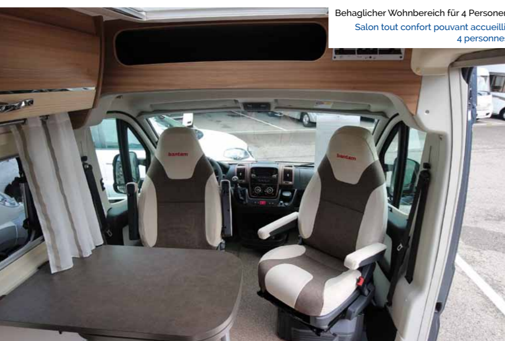
Behaglicher Wohnbereich für 4 Personen Salon tout confort pouvant accueillir 4 personnes